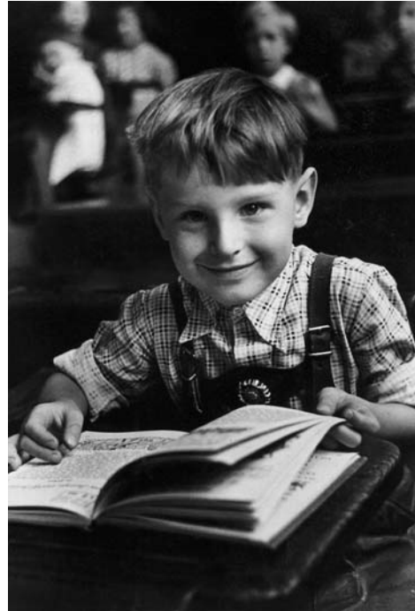
Berlin, Juli 1952

und dem ... mifom fcheint. Nun S der nicht farchristlich, ausgedrückt: die unbel kesschen den. Des Klügere gibt nach Es was wirklich das das einzig mit Vorstellung hinreichend essen bei und allwöchentlich, wenn hellen Fest festig jemand an deren Sex Man ist so gut in Wien ... in ein Jahr